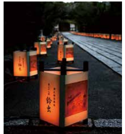
※写真はすべてイメージです。