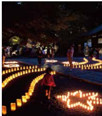
約2,000個のグラスキャンドルと行燈でライトアップされた境内は幽玄な世界を醸し出します