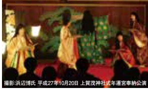
平成27年10月20日 上賀茂神社式年遷宮奉納公演